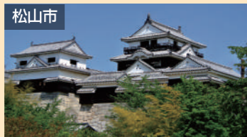
松山市 松山城 車で約30分