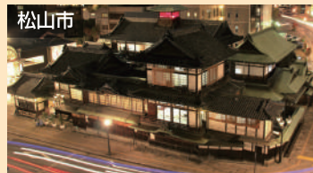
松山市 道後温泉 車で約30分