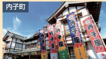
内子町 内子の街並み 車で約40分(松山道経由)