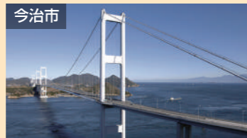
今治市 しまなみ海道 車で約45分(松山道経由)