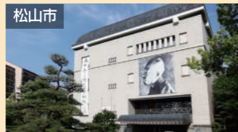
松山市 松山市立子規記念博物館 車で約30分